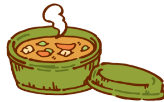
サンラータン 酸辣湯